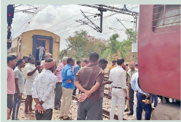
ఎన్6, ఎన్7 భాగల మధ్య ఉన్న జాయింట్ ట్రాక్ కస్టింగ్ విడిపోయిన దృశ్యం

యశ్వంత్రాఫర్ ప్రత్యేక రైలుకు తృటిలో తప్పిన ప్రమాదం అనంతపురం, జూన్ 2 ప్రభాతవార్త బ్యూరో: అనంతపురం జిల్లా గుత్తి రైల్వే స్టేషన్ ఫ్లాట్ ఫారం నంబర్ 1లో నిలిపి ఉన్న యశ్వంత్రాఫర్ ప్రత్యేక రైలు ఎక్స్ ప్రెస్‌ను రెండు కంపోజ్‌లలో నడుమ ఉన్న లాతులు విడిపోవడంతో రైలును స్టేషన్లోనే ఆర్గేషన్‌లో పరిస్థితులలో నిలిపివేశారు. వివరాలు జలా 06571.) మంగళవారం స్థానిక రైల్వే స్టేషన్లో ఒకటవ ఫ్లాట్రాకం పగులుకుంది. ఈ నేపథ్యంలో ఎన్6, ఎన్7 భాగల మధ్యలో ఉన్న జాయింట్ ట్రాక్ కస్టింగ్ విడిపోయాయి. అప్రమత్తమైన లోకేనైలంతో గమనించి రైల్వే ఉన్నతాధికారులకు సమాచారం అందించారు. దీంతో టెక్నిషియన్ రైల్వే సిబ్బంది హాటూపాటిన సంఘటన స్థలానికి చేరుకుని యుద్ధ ప్రాతిపదికన పునరుద్ధరణ చర్యలు చేపట్టారు. మరవతుల అనంతరం రైలు 35 నిమిషాలకు ఆపస్థంగా బయలుదేరింది..ఈ సంఘటనపై రైల్వే అధికారులు వివరాల చేపట్టారు. సాంకేతిక లోపం కారణంగా జరిగిందా... లేదా మరో కారణంగా జరిగిందా... అన్న విషిస్తో కోణాలలో అధికారులు దర్యాప్తు చేపట్టారు.