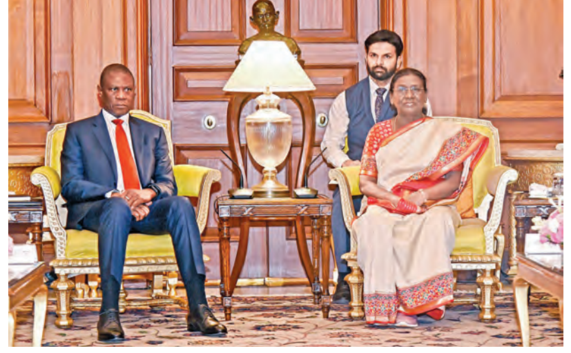
మంగళవారం న్యూఢిల్లీలో రాష్ట్రపతి ముర్ముతో భేటి అయిన దక్షిణాప్రకాశ రిపబ్లిక్ డిప్యూటీ ప్రెసిడెంట్ పాల్ మజిలీ

విజయవాడ,మే2,ప్రభాతవార్త ప్రతినిధి: సర్ విధుల్లో ఉన్న అధికారుల బదలీలపై పివీ ప్రభుత్వం నిషేధం విధించింది.కొద్ద ఎన్నుకల సంఘం అనుమతి లేకుండా.. జూన్ 5 నుంచి సెప్టెంబర్ 22 వరకు అధికారులను బదిలీ చేయొద్దని పివీ ప్రభుత్వం ఆదేశాలు జారీ చేసారు..జిల్లా కలెక్టర్లు, సబ్ కలెక్టర్లు, ఆర్డీవారు, మున్సిపల్ కమిషనర్లు, తహశీల్దార్లు, పంచాయితీ రాజ్యదర్శులు, పంచాయితీ ఉద్యోగులు, బూత్ స్థాయి ఉద్యోగుల బదిలీలపై నిషేధం ఉంటుంది.